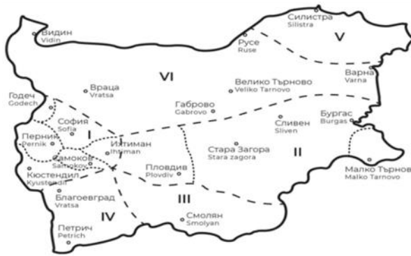
Етнографска карта на България, според която Козичино(Еркеч) е в Тракия, а Голица в Северна България.

Произхода на ваяците неспира да буди любопитството на множество изследователи, антрополози, археолози, лингвисти, фолклористи и краеведи. Много и разнообразни са обичайте в Еркеч и Голица, без аналог са и обредите свързани с тях. Регионалната структура на тази обредност не се наблюдава никъде другаде в страната. Трудно можем да сложим граница в традициите, бита и културата на трите села, които съвсем формално приемаме, като люлка на ваешката традиция. Макар двете от тях във Варненски, а другото в Бургаски административен окръг, независимо от факта, че чисто географски тези три села попадат в различно райониране ние можем да ги обединим, като един самостоятелен етнографски ареал съобразено с фолклорната им специфика и единтичност.